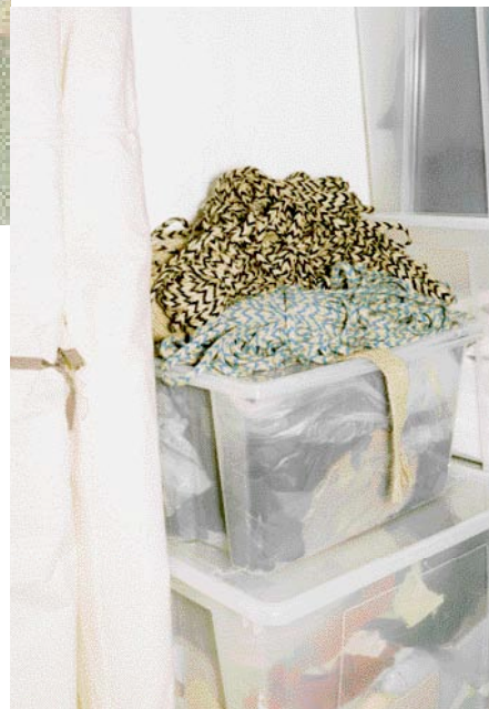
^Stoffe und weiteres Material beziehen die beiden Designerinnen aus dem In- und europäischen Ausland.